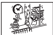
振動の激しい場所